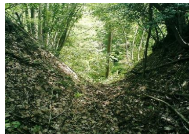
礫石置き場付近の大堀切