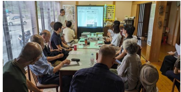
たたら講演会の模様