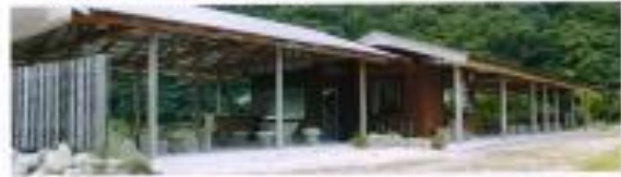
ゴルフ場・ゴルフ倶楽部の整備完了 (定員300名収容)