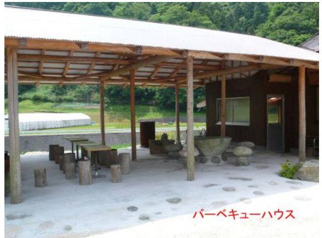
バーベキューハウス