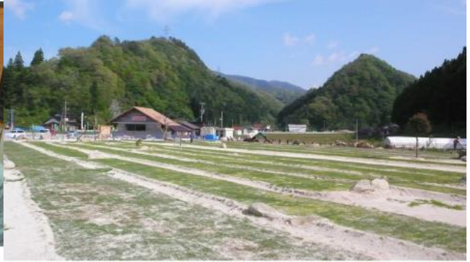
芝生の養生中のコース 2009. 6. 1