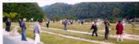
11月18日(金)日は、当G.G.場で、3歳児特別講習会が浜市会館で午前中開催されます。

【用具使用料】 一人 200円(クラブ・ボール) 【プレー後の入湯券】 200円(50% OFF) 【バーベキュー場の利用料】 一人 200円