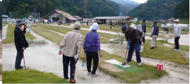
ペアー大会の様 2009. 10. 24