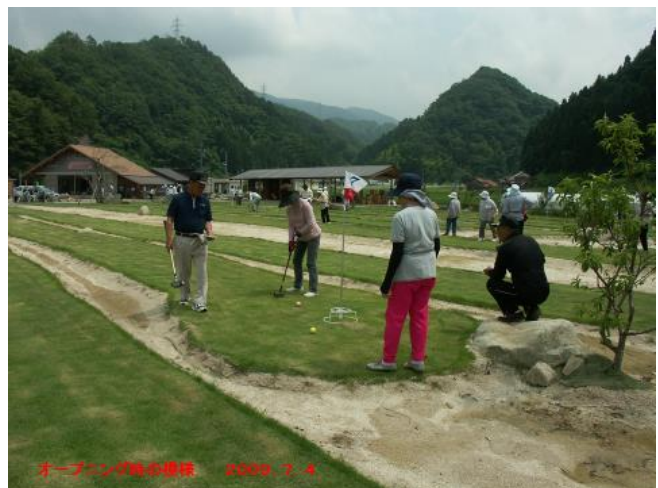
オープン前日の地元開放デー 2009. 7. 4