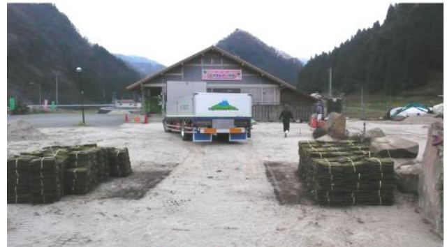
コース整備 2008. 12. 20