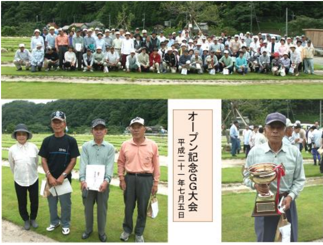
オープン記念GG大会 平成二十一年七月五日