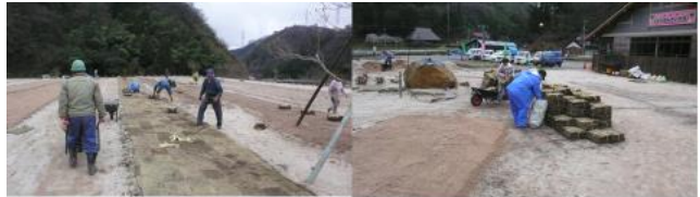
自前による芝生の植栽の様様