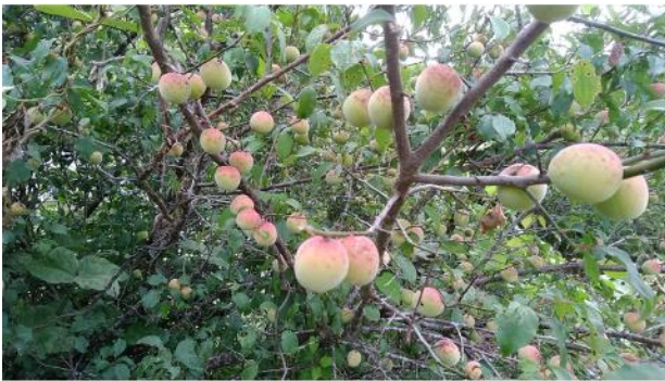
ほたる梅園の「南高梅」