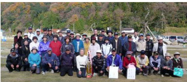
チャンピオン大会(7月~10月の4大会 で選抜された皆さん) 11月25日(水)