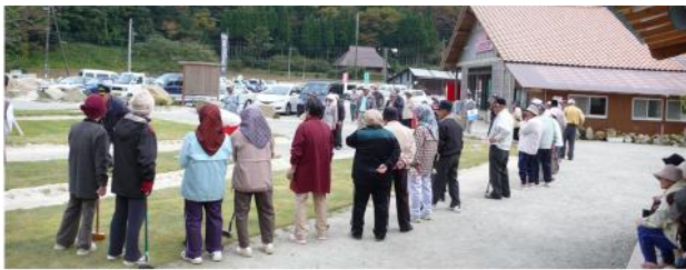
金城抱月ライオンズクラブ主催 「チャリティグラウンド・ゴルフ大会」時の ホールインワン大会 2009. 10. 25