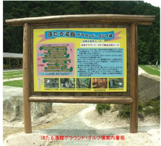
ほたる温泉グラウンド・ゴルフ場案内看板