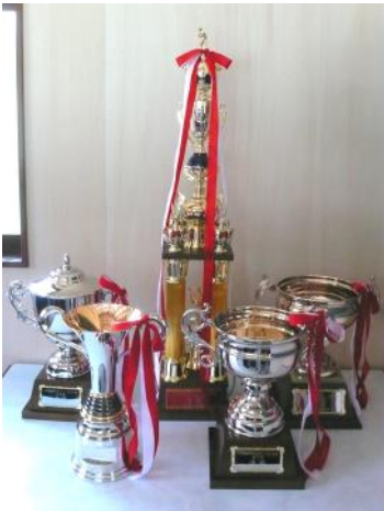
各種大会用のトロフィー・カップ 寄贈者 加治木養蜂場 加治木 魁 様