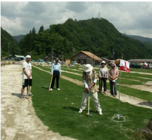
波佐温泉ほたる湯館 グラウンド・ゴルフ場完成