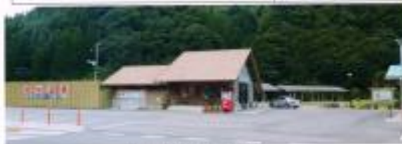
駐車場が整備されたほたる温泉周辺

平成24年 9月 2日 新田町金城町電話 ☎ 267-2 波佐・小国温泉観光協会 TEL 09852-44 - 0555