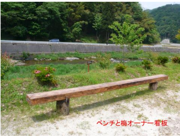
ベンチと梅オーナー看板