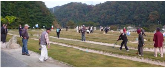
各種大会時のスナッフ