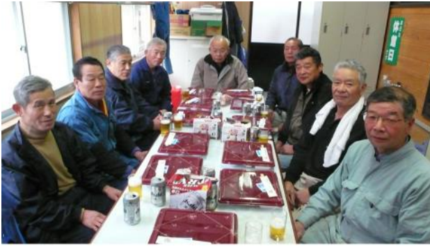
クラブハウス完成祝い 2009.7