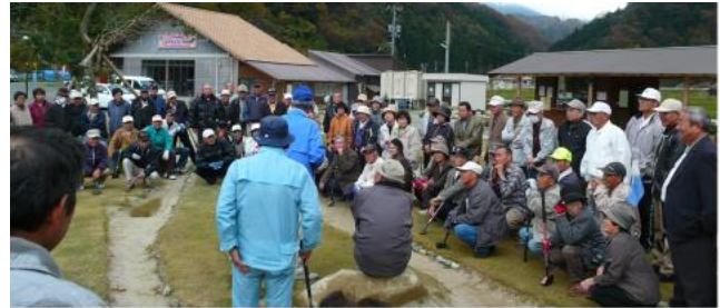
Gゴルフ3級指導者講習会 ときわ会館(講習) / ほたる湯館GG場 (実技指導) 11月13日(金)