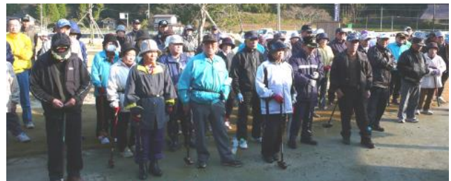
日本グラウンド・ゴルフ協会 「第一回会員交流大会」 12月 5日(土)