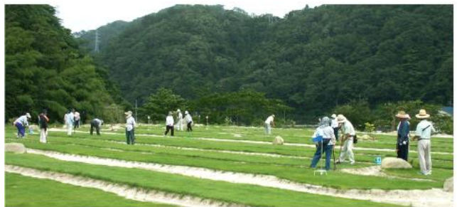
オープン前日の地元開放デー 2009. 7. 4