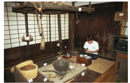
浜田市金城民俗資料館・囲炉裏の間