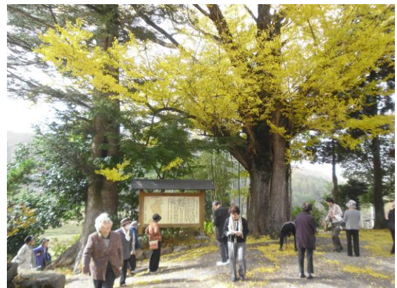
光超寺の大イチョウ