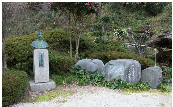
島村抱月生誕地顕彰の杜公園